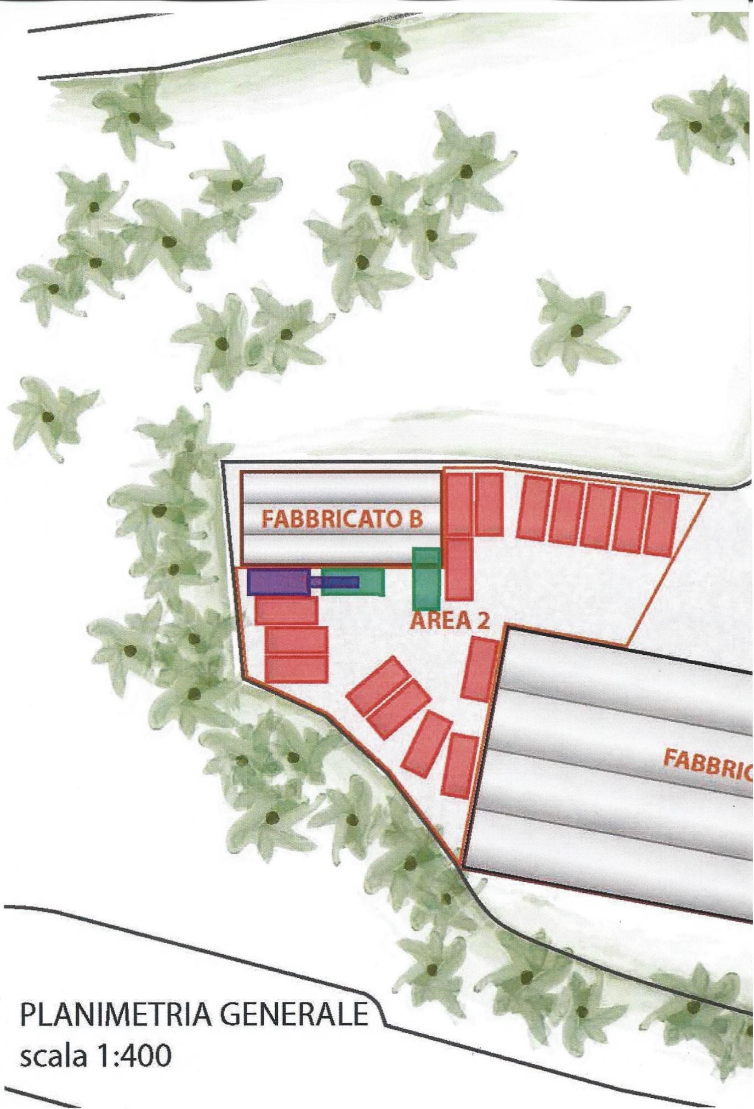
PLANIMETRIA GENERALE scala 1:400